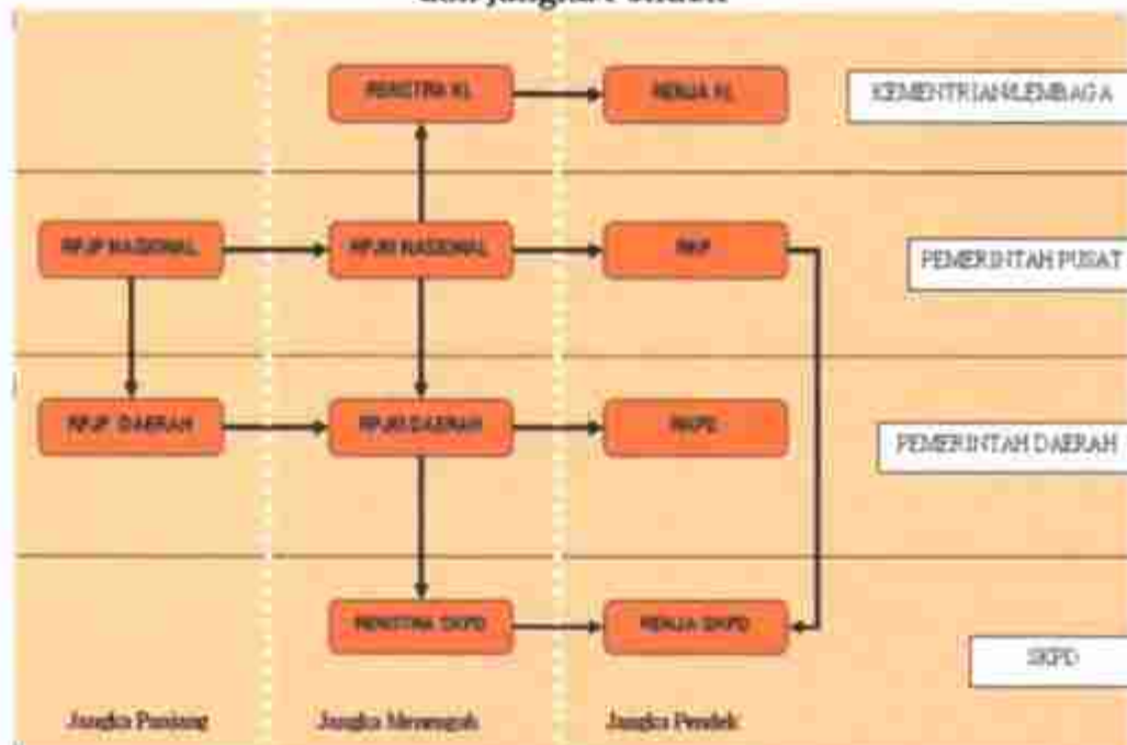
Gambar 1.2 Hubungan Antara Perencanaan Jangka Panjang, Jangka Menengah dan Jangka Pendek

Implementasi RPJMD setiap tahun dijabarkan dalam bentuk RKPD. Masing-masing Perangkat Daerah menyusun prioritas program tahunan, sehingga pencapaian tujuan lebih fokus, efisien, dan efektif. RKPD yang merupakan dokumen perencanaan jangka pendek disusun berdasarkan pertimbangan hasil Musrenbang yang dilaksanakan secara berjenjang.